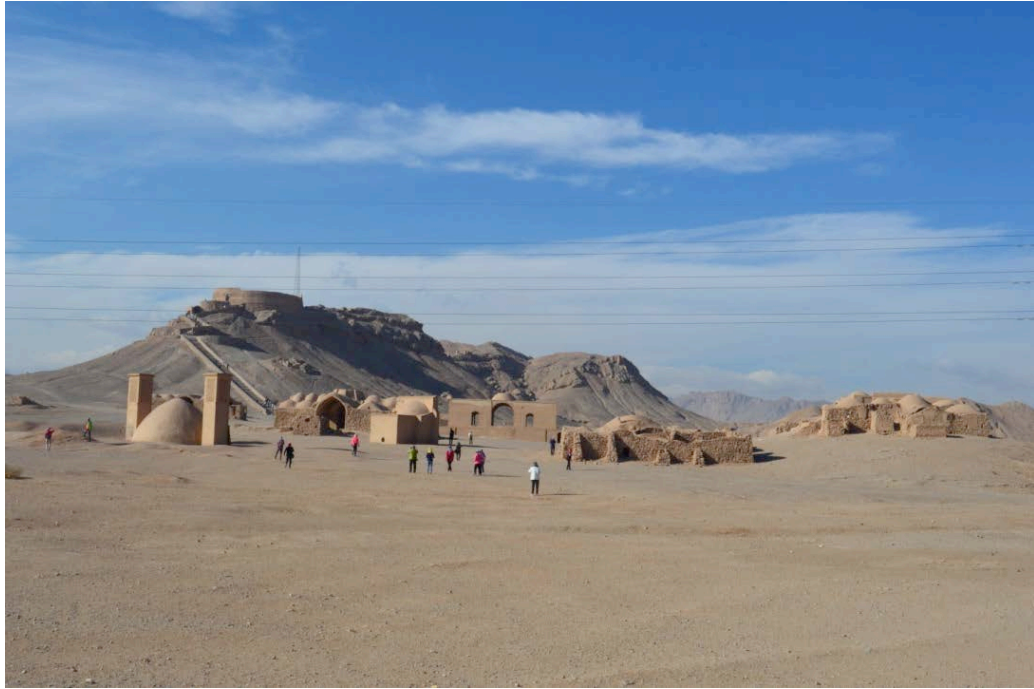
Yazd, Parco Archeologico delle Torri del Silenzio