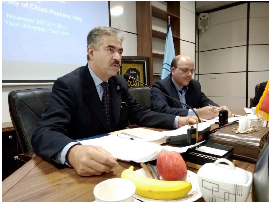
Yazd, 20 Novembre 2017, sottoscrizione MOU presso l'Università.