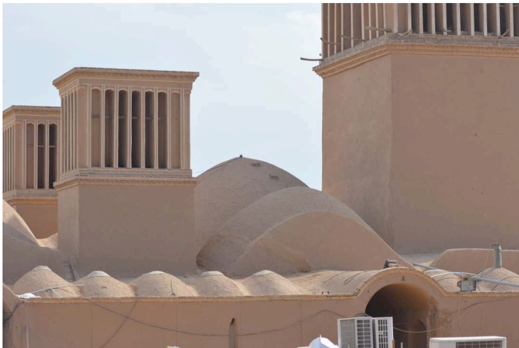
Centro storico di Yazd, sito UNESCO, Giardino Dolat Agabat, Torri del Vento.