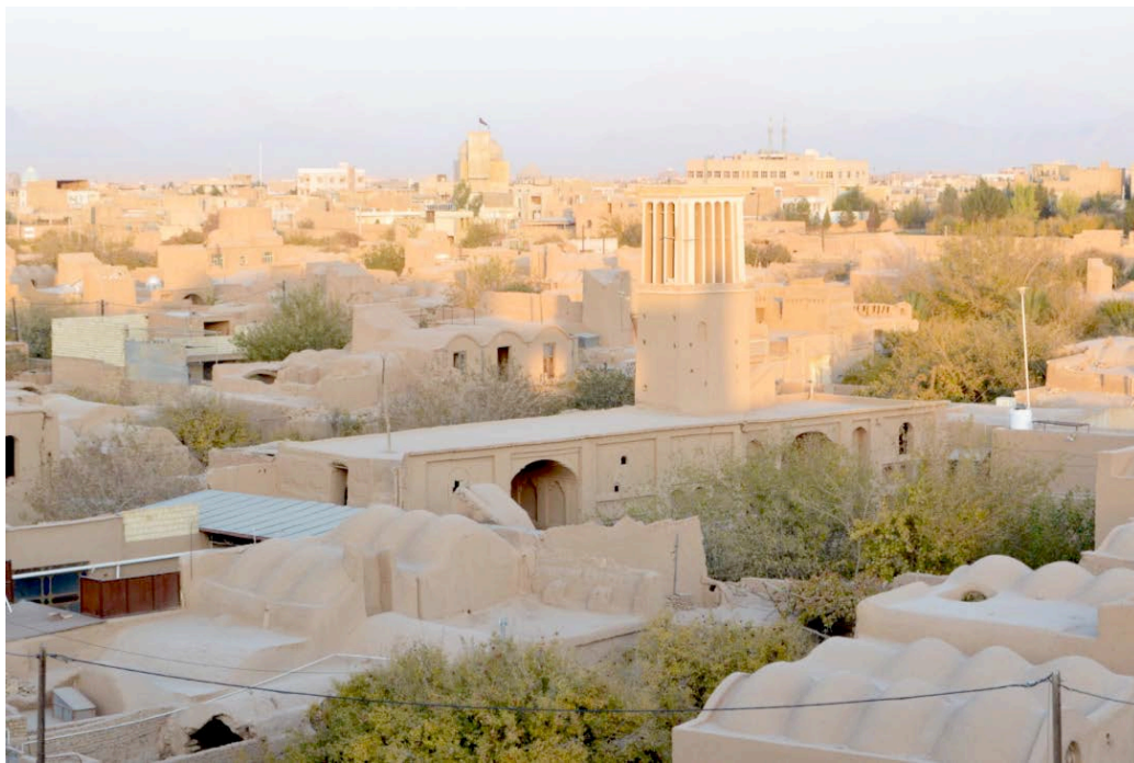
Meybod, vista del centro storico dal castello di Narin (V millennio A.C.)