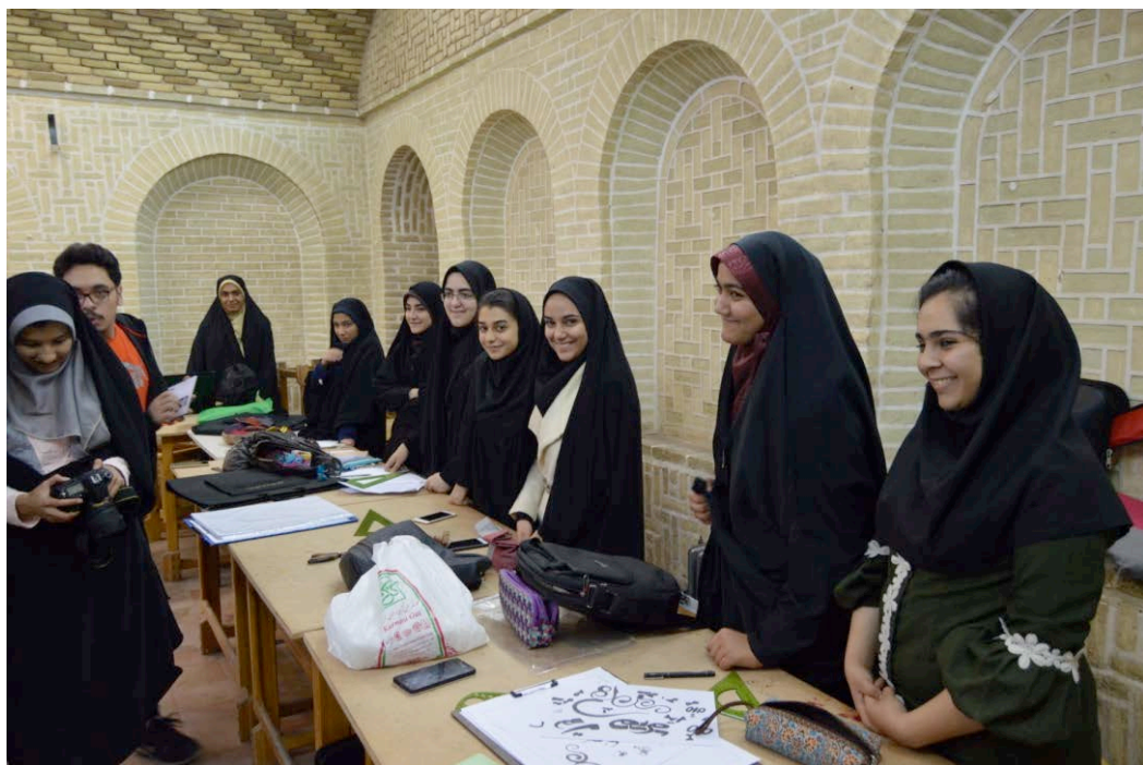
Scuola di Architettura e Arte, centrostorico di Yazd