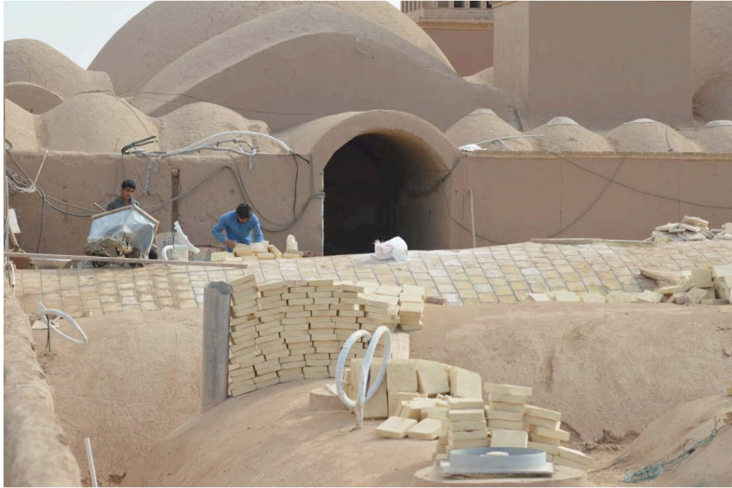
Yazd, giardino di Dolat Agabat, interventi di riabilitazione in Adobe (terra cruda)